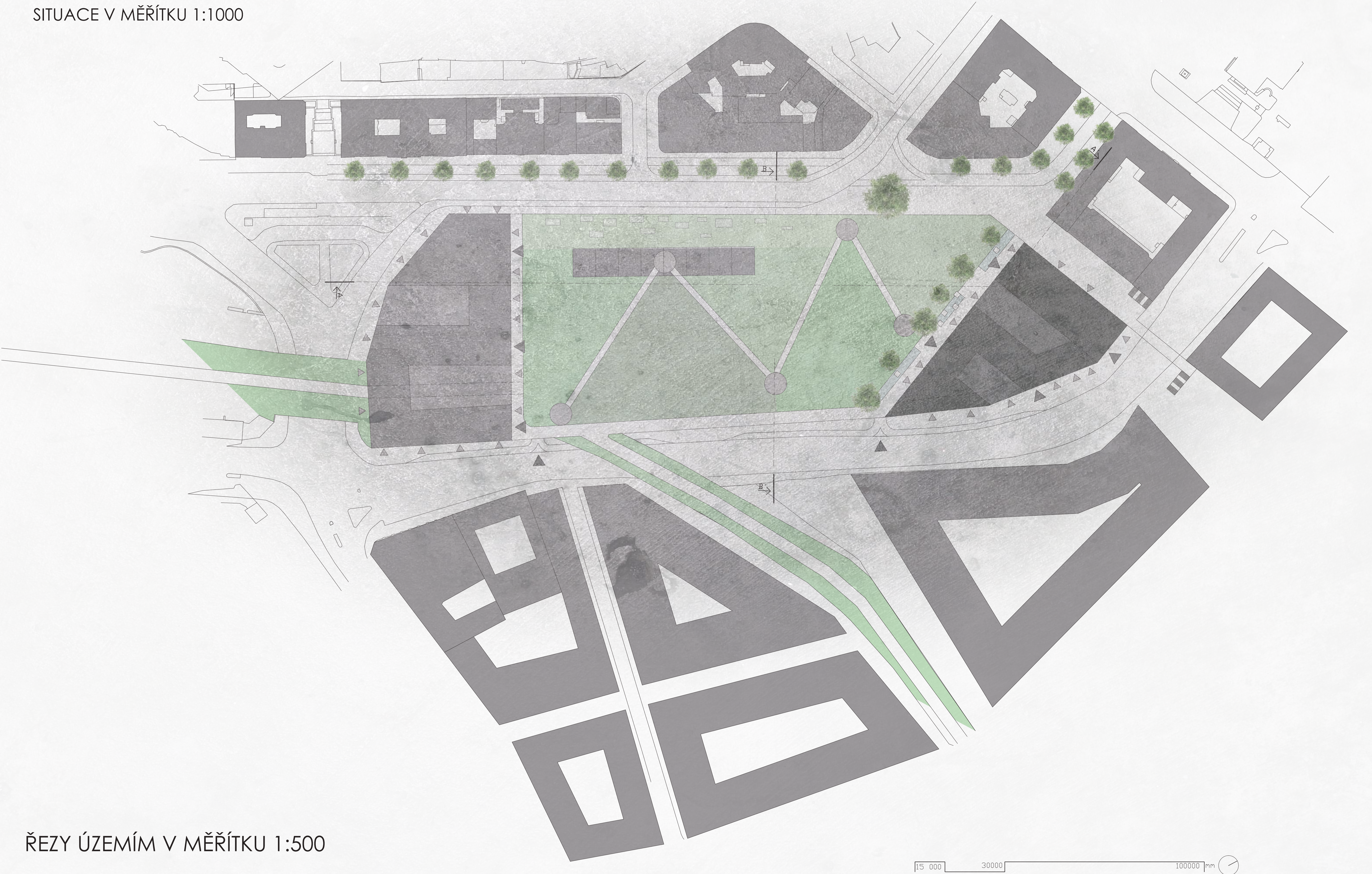
ŘEZY ÚZEMÍM V MĚŘÍTKU 1:500